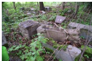
Obalone pomniki, zagrzezione w lasach cmentarza, czekają na renowację.

11. Las i mur cmentarny. Kilka lat temu młody las porastał prawie 50% powierzchni cmentarza. Obecnie, dzięki postępowi w karczowaniu, około 30% pozostaje pod baldachimem niedojrzałych drzew i roślinności. Pod tym gęstym lasem i liśćmi można znaleźć nagrobki w różnym stanie nieładu. Niektóre próby udokumentowania tych nagrobków zostały podjęte na początku XXI wieku, ale konieczne są systematyczne działania renowacyjne. Należy zachować ostrożność podczas zwiedzania tego lasu ze względu na jego nieład i obecność dzikich zwierząt. Jelenie, rude lisy, a także kleszcze i komary odstraszać zwiedzających. W końcu las ten ustępuje miejsca mурowi oddzielającemu Bagnówkę od przylegającego do niej Cmentarza Katolickiego.