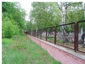
Odrestaurowana ściana północna przylega do Cmentarza Katolickiego, 2010 r.

12. Puste odcinki? Od drugiego wejścia na Wschodniej w kierunku Zespołu Memorialnego znajdują się odcinki, które wydają się być niemal pozbawione nagrobków. Prace renowacyjne w latach 2018-19, 2022 ujawniają, że nagrobki mogą jeszcze dziś spoczywać pod warstwami trawy i wierzchniej warstwy gleby. Prace renowacyjne rozpoczną się tutaj w 2023 roku i będą kontynuowane aż do ich zakończenia. Dziś wygląd tych pustych fragmentów stanowi niezwykle przekonujący komentarz wizualny na temat braku życia żydowskiego i żydowskiego dziedzictwa we współczesnym Białymstoku.