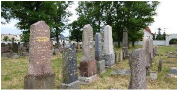
Kobiety, które zmarły "w zamknięciu" na przełomie XIX i XX wieku. (Część 2) W tle, po prawej stronie, znajduje się główne wejście.