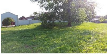
Domki dozorczy i Towarzystwa Pogrzebowego pod wzgórzem.

Obok tego wzgórze znajdują się stopy i pojedyncze nagrobki zwrócone z różnych miejsc w całym Białymstoku. Prawdopodobnie stały one kiedyś na Cmentarzu Rabinicznym lub na Cmentarzu Cholerycznym w Białymstoku. Tutaj też znajduje się duży głaz megalityczny, ostatni nagrobek ze Starogo Cmentarza Rabinackiego, obecnie Parku Centralnego, przeniesiony w 2007 roku. Pod baldachimem drzewa zwiedzający może zobaczyć także nagrobek z Bagnówki, przerobiony na kamień od ostrzenia. W sierpniu 2022 roku kamień ten został zwrócony.