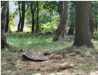
Miejsce pochówku szczątków z grodziska w Bagnówce.

Na NW rogu sąsiedniego odcinka, pod zagajnikiem dębów spoczywa prosty glazowy nagrobek. Stoi on na niedawnym pochówku (sierpień 2022) kości ludzkich znalezionych przy niedawnym wydobyciu 123 nagrobków z kopca, znajdującego się na daleko na wschodzie nieużywanej ziemi Bagnówka. Nagrobki i szczątki ludzkie pochodzą najprawdopodobniej z Cmentarza Rabinicznego zasypanego obecnie pod Parkiem Centralnym w Białymstoku. Macewy te opisane są w dalszej części przewodnika.