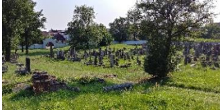
Widok na główne wejście z pagórka.

7. Punkt widokowy. Stojąc na wzgórzu przy głównej arterii północ-południe, w połowie drogi pomiędzy głównym wejściem a ohelem (mauzoleum) rabina Halperna, odwieczający ma bardzo prowokujący widok 360° na cmentarz i jego otoczenie. Od razu rzucają się w oczy obszary wymagające renowacji w lasach i trawiastych częściach wschodnich. Jednak renowacja centralnych części cmentarza przeprowadzona przez BCRP w latach 2017-2019 przywróciła mu dawną świetność. Poza murami cmentarza łatwo dostrzec porządek Cmentarza Katolickiego oraz codzienne życie, które toczy się na okolicznych ulicach mieszkalnych.