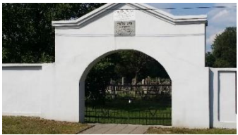
Przy wejściu głównym od strony ulicy Wschodniej znajduje się modlitwa w języku aramejskim.

Pod tą tablicą, przypominającą zwiedzającym o czekającej ich sferze sacrum, znajdują się czarne, kute bramy, przez które zwiedzający uzyskuje dostęp i pierwszy rzut oka na największy cmentarz żydowski w północno-wschodniej Polsce - o powierzchni czterdziestu akrów (ok. szesnastu hektarów), który w szczytowym momencie, na początku lat 30. ubiegłego wieku, mógł pomieścić trzydzieści pięć tysięcy pochówków. Panorama ukazuje połowę ze stu prawie jednakowych rozmiarów sekcji tego beth olam , z których każda jest ograniczona trawiastymi alejkami biegnącymi zarówno z północy na południe, jak i ze wschodu na zachód. Drugie wejście znajduje się dalej na wschód przy ulicy Wschodniej, trzecie przy dawnej ulicy Cmentarnej na jego zachodniej granicy, a wejście dla służby przy jego północno-wschodnim narożniku. Cmentarz ten został założony w grudniu 1891 roku i funkcjonował do 1969 roku, z nielicznymi pochówkami, jednak w czasie II wojny światowej, kiedy to ograniczono pochówki do Cmentarza Getta. Obecnie około 15% grobów jest nadal oznaczonych nagrobkami.