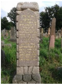
Dwujęzyczny, hebrajsko-rosyjski napis Chwolesa brzmii:

W pobliżu frontu tej części znajduje się również grób Sory, żony Józefa Zamenhofs (zm. ok. 1900), ciotki Ludwika (Lajzera) Zamenhofs , twórcy esperanto. W pobliżu frontu tej części stoi odrestaurowany niedawno megalityczny pomnik dyrektora banku Dora Chwolesa (zm. 1906). Po dziesięcioleciach leżenia twarzą w ziemi, nagrobek ten został ponownie postawiony w 2016 roku, przy użyciu zawiesi i łyżki koparki. Stojąc na wysokości ponad siedmiu stóp i ważąc prawie 1,5 tony, może być największym zachowanym pomnikiem na Bagnówce.