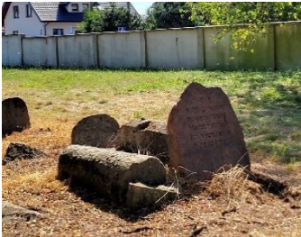
Najstarszy zachowany do dziś nagrobek, 27 grudnia 1891 r.

Zachęcamy zwiedzających do zwrócenia uwagi na różnorodność nagrobków w tych sekcjach i podczas zwiedzania cmentarza. Granitowe obeliski kontrastują z tradycyjnymi nagrobkami z piaskowca aszkenazyjskiego, odzwierciedlając tradycyjny świat wczesnego Białegostoku, który znalazł się pod wpływem nowoczesności. Zwróć uwagę na różnorodność tradycyjnych żydowskich symboli pogrzebowych, np. świece upamiętniają kobiety, a dwie ręce uniesione w modlitwie - przodków z linii kapłańskiej (cohen). Połamane drzewa i zerwane kwiaty obrazują koniec życia. Sporadycznie pojawiają się również symbole ludowe, takie jak regionalny chaber.