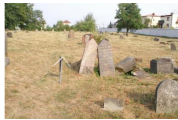
Przed niemal pustymi kwaterami stoją nagrobki krewnych Sendera Blocha, jednego z pionierów przemysłu tekstylnego w Białymstoku (kwatery 4).

przypadków) zmarli śmiercią naturalną. Prace konserwatorskie w 2018 roku pokazują, że nagrobki mogą nadal opierać się pod warstwami trawy i gleby. Widok tych pustych kwater stanowi niesamowicie frapujący komentarz dotyczący nieobecności żydowskiego dziedzictwa we współczesnym funkcjonowaniu Białegostoku.