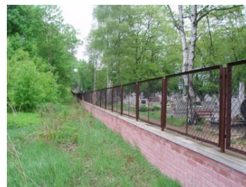
Odnowiony mur od strony północnej granicy z cmentarzem rzymskokatolickim, 2010.

12. Puste kwatery. Kierując się od drugiego wejścia przy ulicy Wschodniej ku części środkowej i Komplexowi Memorialnemu, natknąć się można na takie miejsca, w których bardzo trudno o jakiegokolwiek nagrobki. Do wczesnych lat 40. ubiegłego stulecia w każdym rzędzie bardzo ciasno lokowano nagrobki upamiętniające zmarłych Żydów, którzy (w większości