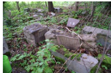
Przewrócone pomniki, umoszczone w cmentarnym poszyciu leśnym, czekają na remont.

11. Drzewa i mur cmentarny. Kilka lat temu młody las porastał niemal połowę powierzchni cmentarza. Mimo systematycznych prac mających na celu jego uprzętnienie nadal około 30% cmentarza jest pokryte małymi drzewami i okrywą roślinną. Pod gęstym poszyciem leśnym i listowiem nagrobki znajdują się w stanie mniejszego lub większego nieporządku. Prace nad ich dokumentacją podjęte zostały na początku XXI wieku, konieczne są jednak działania, które prowadzone by systematycznie. W pewnym momencie las ustępuje niedawno odnowionemu murowi oddzielającemu Bagnówkę od sąsiadującego cmentarza rzymskokatolickiego.