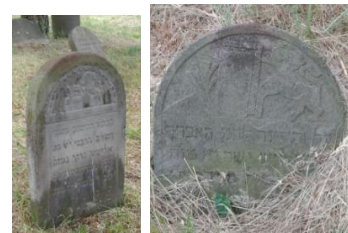
Dwie improwizacje na temat Lwa (uczonego) jako protektora Tory.

zróżnicowane motywy sztuki ludowej znajdują się na tym cmentarzu: tylko w samej tej kwaterze znaleźć można aż dziewięć improwizacji na temat Lwa Judy – symbolu wywodzącego się z tekstu biblijnego. Gdy lew stoi obok złamanego drzewa lub choćby złamanej gałęzi – dwóch florystycznych znaków symbolizujących życie – wskazywać może na potęgę śmierci nad życiem. Lew może także otaczać księgę (księgi); zwierzę to jest również postrzegane jako protektor Tory (uświęconej żydowskiej literatury i tradycji) i może symbolicznie przedstawiać nieżyjącego uczonego. Niekiedy wcale nie przypomina tego dumnego i przerażającego zwierzęcia, jakim jest w rzeczywistości, raczej przywołując na myśl byka. Taka różnorodność interpretacyjna wskazuje na to, że nad wizerunkiem Lwa Judy pracowało wielu rzemieślników. Niektórzy korzystali z tego samego wzorca, dodając jedynie oryginalne szczegóły.