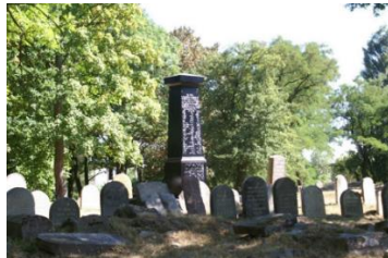
Przednia fasada czarnego obelisku upamiętniającego ofiary masakr (1905 r.) oraz białostockiego pogromu (1906 r.).

jednak część kwater nadal wymaga działań naprawczych. Dotyczy to zwłaszcza kwatery 26, na terenie której, po wstępnie przeprowadzonych pracach, odkryto obecność szczątków ofiar brutalnych ataków przeprowadzonych już po roku 1906.